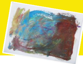
詳しくは裏面を チェック