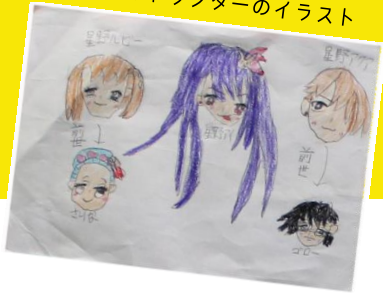
好きなキャラクターのイラスト